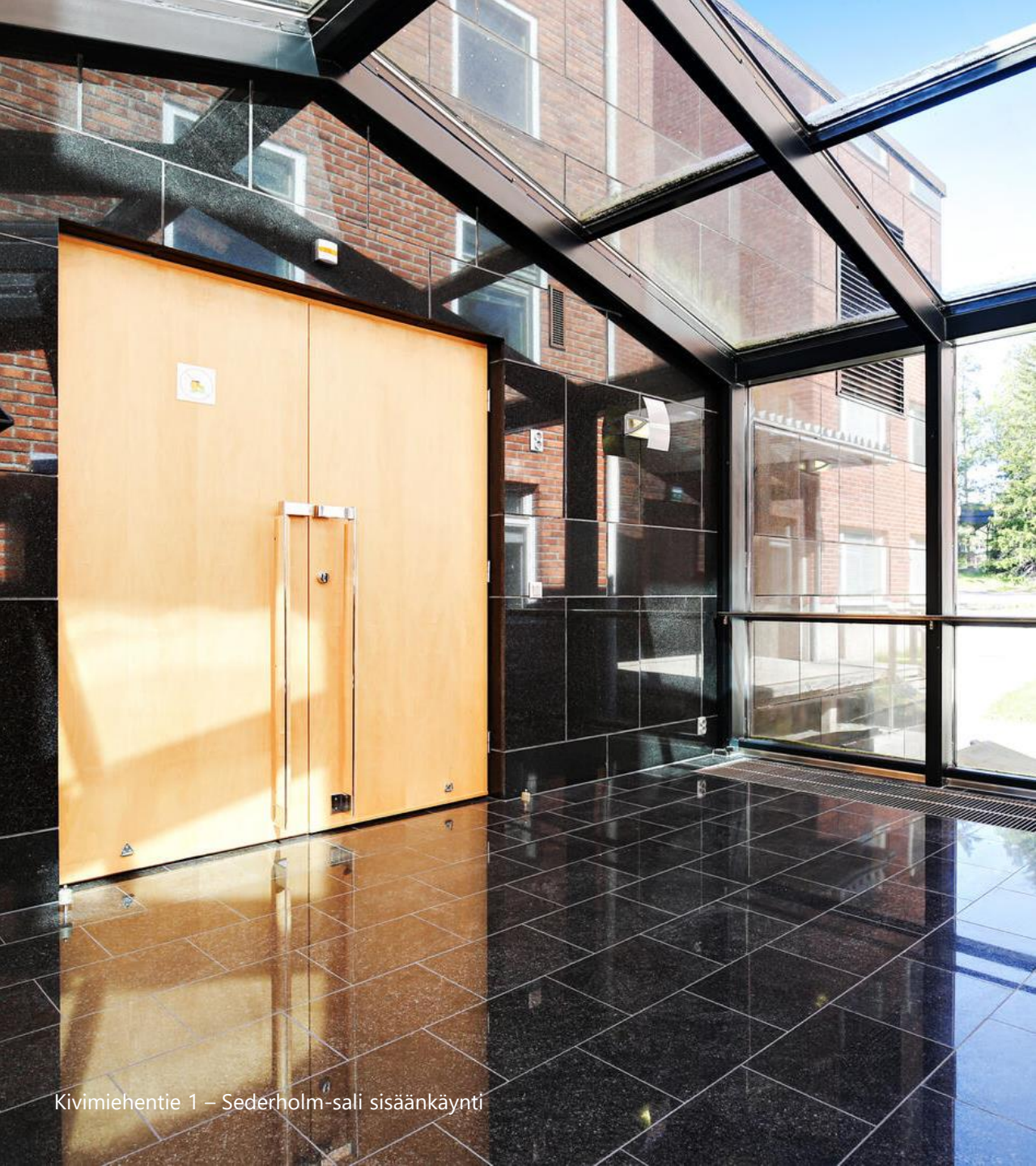
Kivimiehentie 1 – Sederholm-sali sisäänkäynti