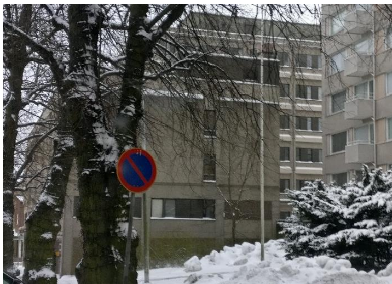
Kuva 2. Tontin koilliskulma