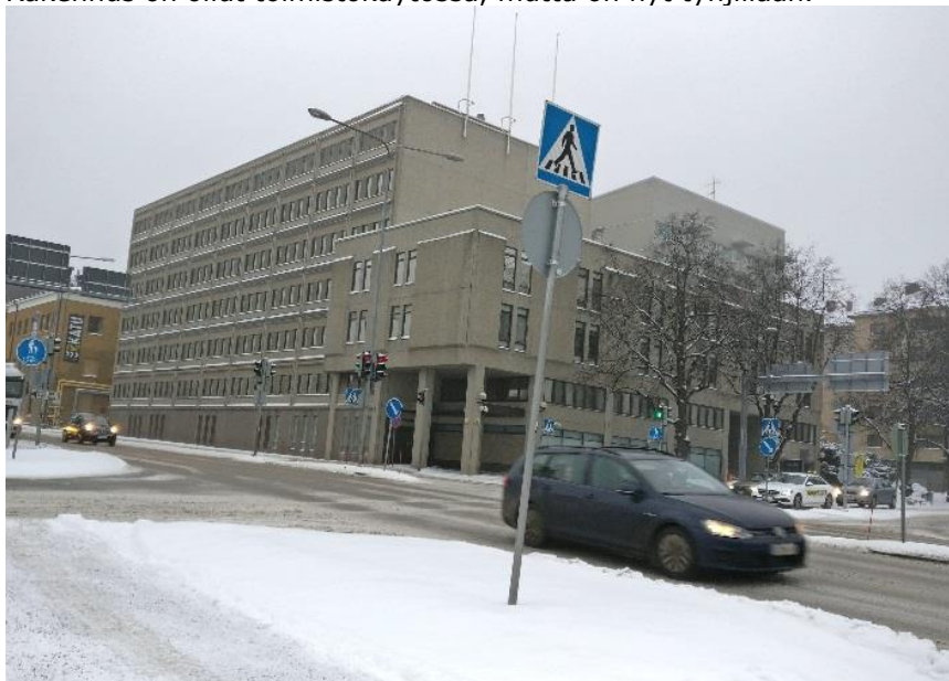
Kuva 1 Kohde kaakosta, matkakeskuksen suunnasta

Rakennus on ollut toimistokäytössä, mutta on nyt tyhjiään.