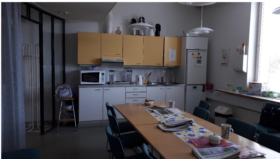
1 krs taukotila