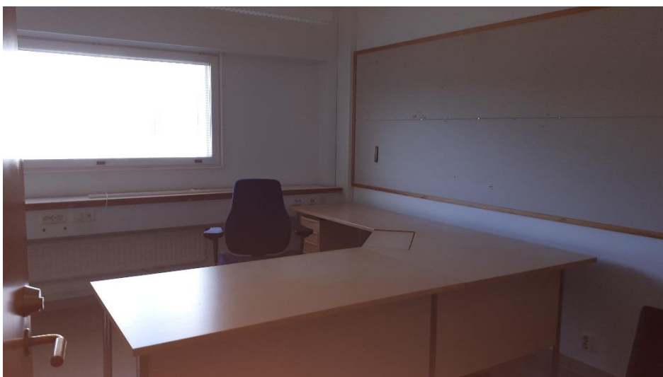
3 krs toimistohuone