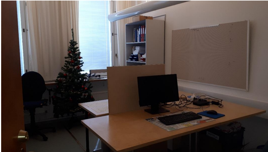
1 krs toimistohuone