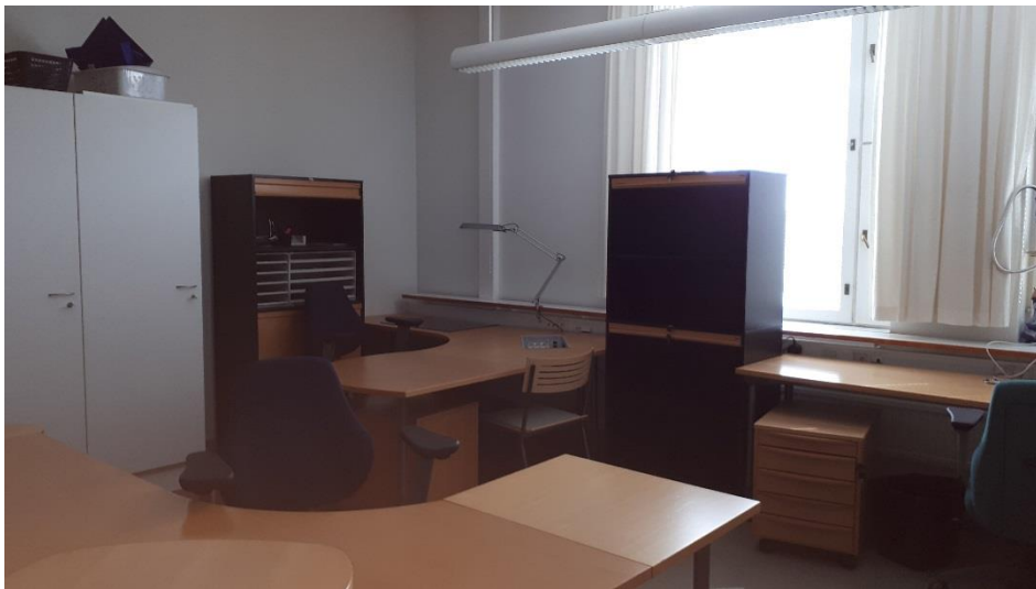
4 krs toimistohuone