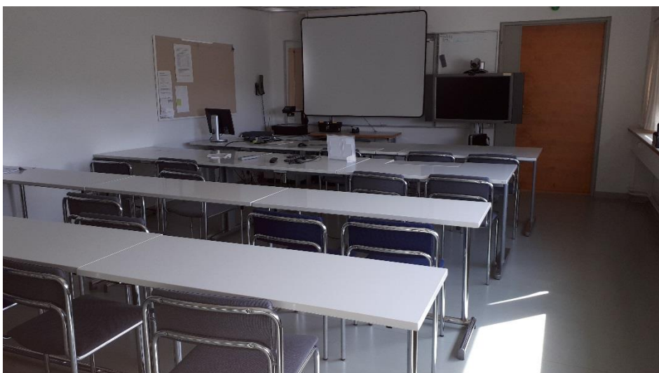
4 krs toimistotilaa