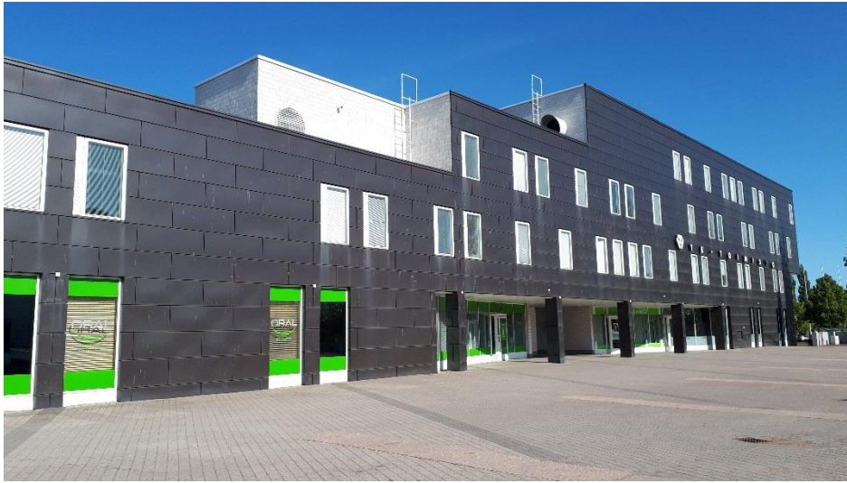
Rakennuksen julkisivu kaakkoon