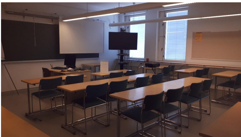
2 krs toimistotilaa