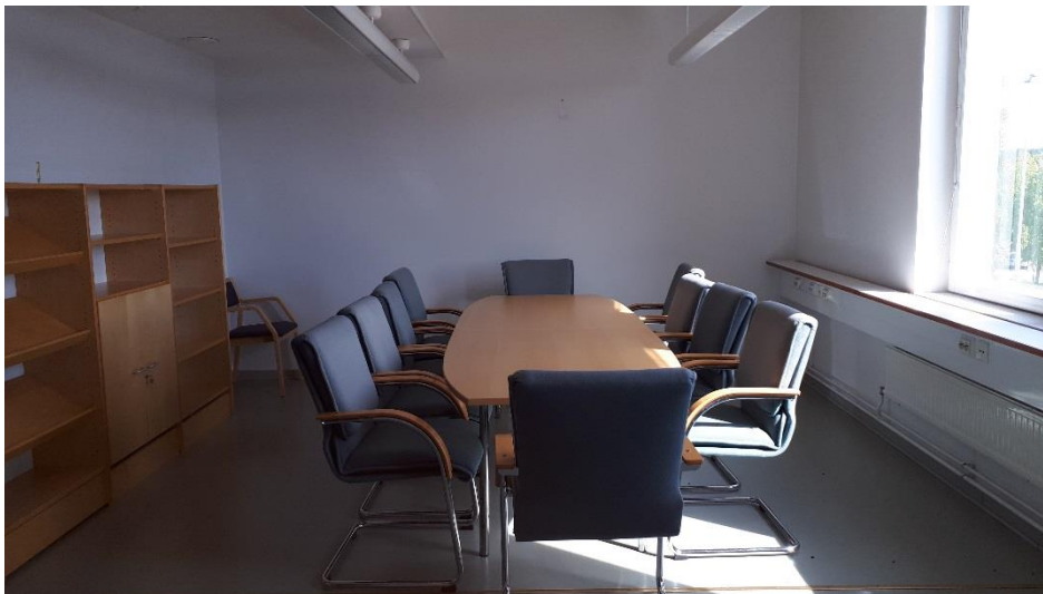
3 krs neuvottelutila