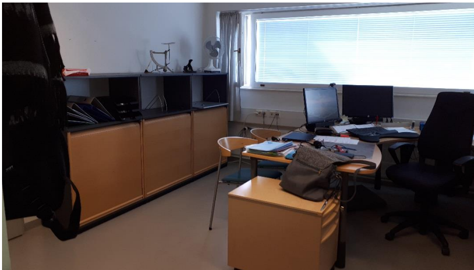
2 krs toimistohuone