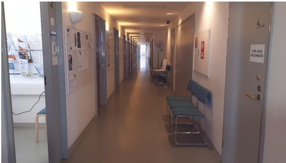
1 krs käytävätilaa