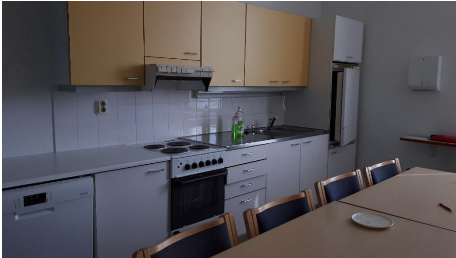
3 krs taukotilaa