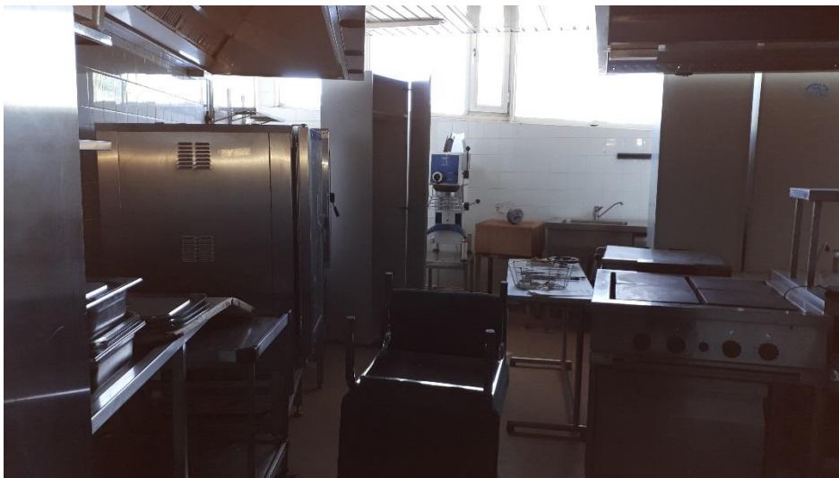
Huoneisto 9 ravitsemuskeskus