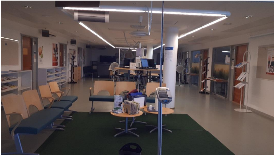
1 krs toimistohuoneisto