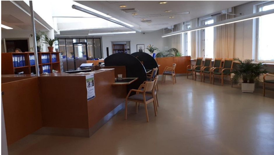
4 krs palvelupiste