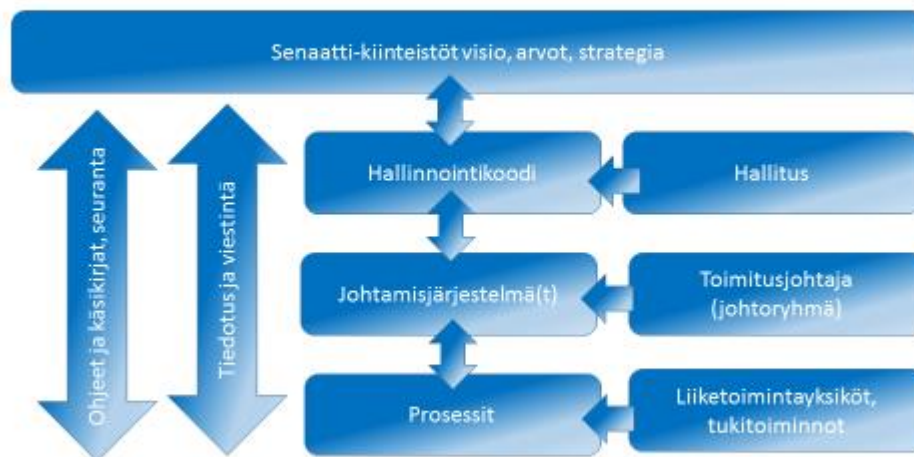
Senaatti-kiinteistöjen toiminnanohjauksen yleiskuvaus

Hallinnointikoodi on Senaatti-kiinteistöjen hallituksen hyväksymä. Hallinnointikoodin ohella Senaatti-kiinteistöjen toiminnanohjauksen olennainen osa on toimitusjohtajan vastuulla oleva (yleinen) johtamisjärjestelmä. Johtamisjärjestelmä on yhteiskuntavastuun osalta myös sertifioitu (ISO 14001 -ympäristöjohtamisjärjestelmä).