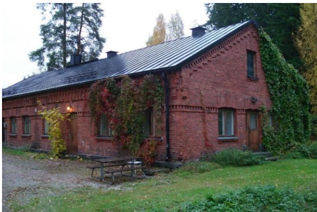
Entinen sosiaalirakennus (nro 15)