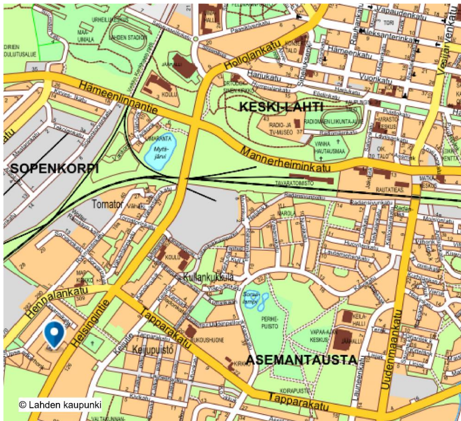
Kuva: Hennalan sijainti kartalla

Suomen valtio /Senaatti-kiinteistöt omistaa Lahden Hennalassa entisen varuskunta-alueen, jota ollaan kehittämässä uudeksi mielenkiintoiseksi asuin- ja työpaikka-alueeksi. Alueella olevat satavuotiset punatiiliset rakennukset ovat jo löytäneet uudet omistajansa ja saneeraustoiminta on käynnissä alueen eri puolilla. Hennalan alueelle kaavoitetaan vaiheittain myös uudisrakentamista. Hennala sijaitsee pari kilometriä etelään Lahden keskustasta. Junamatka Lahdesta Helsinkiin taittuu alle tunnissa.