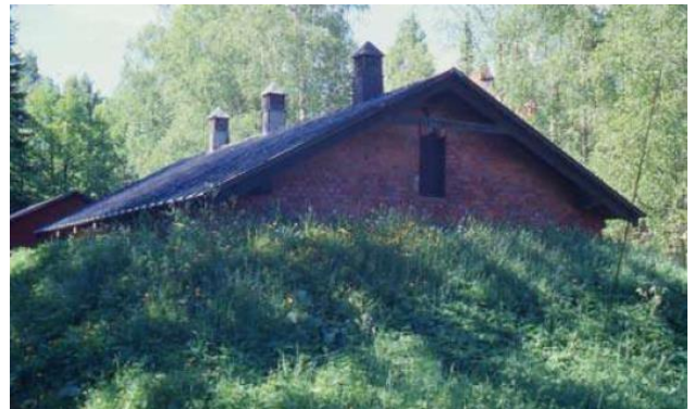
Varastorakennus nro 13 tontilla 1