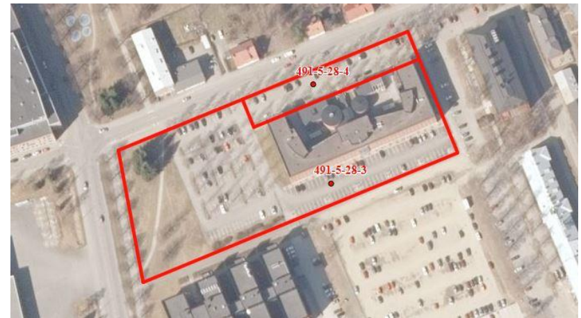
Kartta: Julkaisulupa nro 5559/MML/15