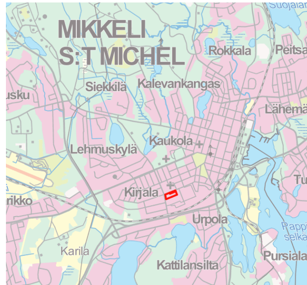
Kartta: Julkaisulupa nro 5559/MML/15