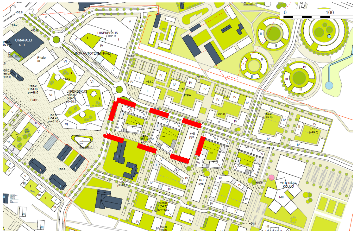
Kuva: Arkkitehtuuritoimisto B&M Oy Arkkitehtitoimisto Harris-Kjistik Oy WSP Finland Oy