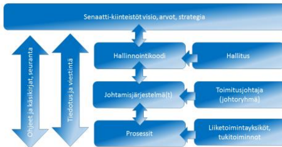
Senaatti-kiinteistöjen toiminnanohjauksen yleiskuvaus

Vuoden 2015 selvitys hallinto- ja ohjausjärjestelmästä on hyväksytty saman vuoden toimintakertomuksen yhteydessä ja julkaistaan erillisenä selvityksenä Senaatti-kiinteistöjen internetsivuilla kokonaisuudessaan. Se on osa Senaatti-kiinteistöjen yhteiskuntavastuuraportointia.