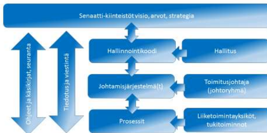
Senaatti-kiinteistöjen toiminnanohjauksen yleiskuvaus

Hallinnointikoodi on Senaatti-kiinteistöjen hallituksen hyväksymä. Hallinnointikoodin ohella Senaatti-kiinteistöjen toiminnanohjauksen olennainen osa on toimitusjohtajan vastuulla oleva (yleinen) johtamisjärjestelmä. Johtamisjärjestelmä on yhteiskuntavastuun osalta myös sertifioitu (ISO 14001 -ympäristöjohtamisjärjestelmä).